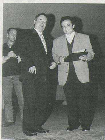
El president de la Societat de Caçadors La Marta, amb la seva distinció