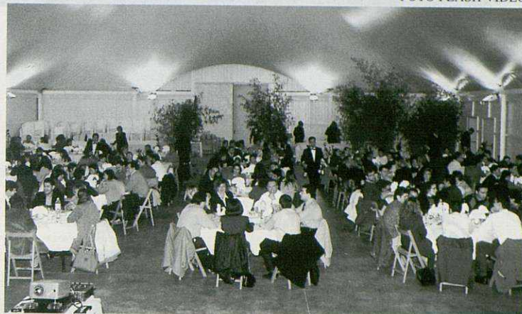
Aspecte que oferia l'interior de l'Envelat municipal de Carrancà, on va tenir lloc l'acte

Les entitats participants a aquesta III a Nit de l'Esport van ser: Club de Futbol Martorelles, Unió Esportiva Bàsquet Martorelles, Veterans Futbol Atl. Martorellense, Unió Petanca Martorelles-Pruneres, Societat de Caçadors La Marta, Veterans Futbol Martorelles, Futbol Sala Femení de Martorelles, Club Esportiu Handbol Martorelles, Moto Club Cent Peus, Alumnes del Gimnàs municipal i Escola esportiva municipal.