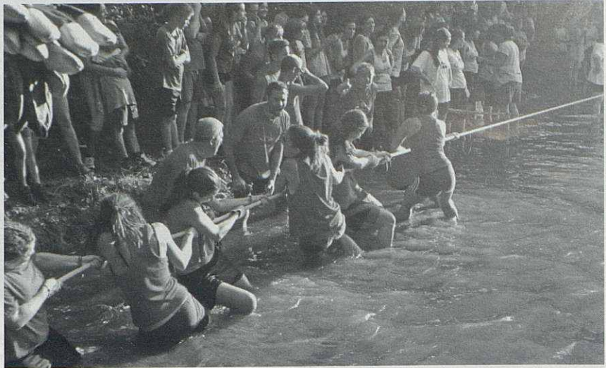
Els colors van tornar a estirar la corda.

El nou curs ha començat a totes les escoles i a l'Institut. El nombre total d'alumnes és de 1400, xifra que representa un descens del 1,2% en