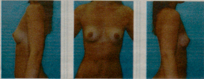
Fotos de la paciente ANTES