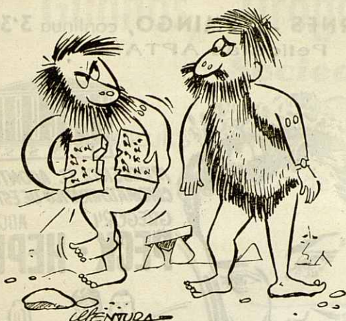
El vocalista desesperado (en la edad de piedra)

¿Ve lo que hago con su música? ¡La rompo en cuatro!