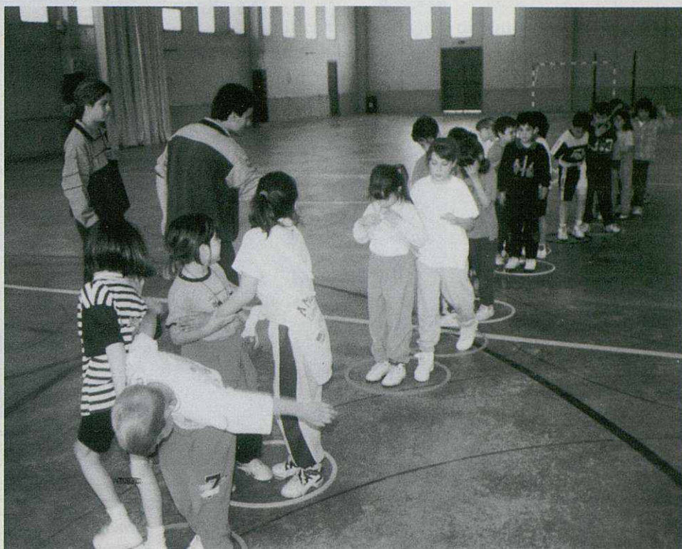
Centre d'Esport Iniciació municipal. 1r nivell, els més petits

També en aquest cas, l'augment d'inscripcions, ha estat considerable, tant en