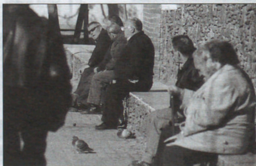
Los jubilados por fin tendrán el esperado casal.

El Ayuntamiento tan sólo deberá ceder a Benestar i Família los terrenos donde se construirán los 1.200 metros cuadrados de casal. Una vez edificado, el equipamiento será propiedad del consistorio, que lo cederá a