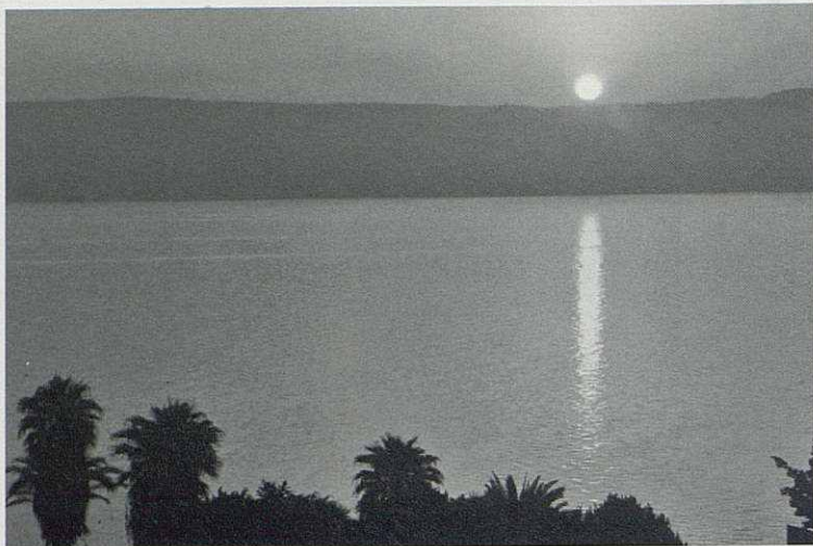
Sortida del sol al llac de Genesaret.