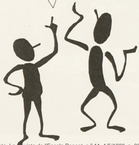
Mares Transi i Jacinta

1- Mares d' alumnes. 2- Està molt bé i és molt bona. 3- Mirar les actuacions. 4- Tot en general. 5- Està molt bé.