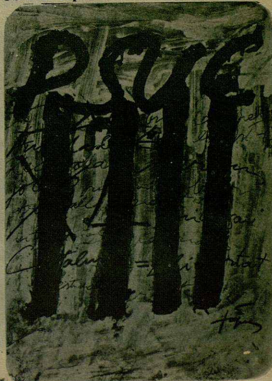
El cartel conmemorativo del 40 aniversario Obra de Tapis.