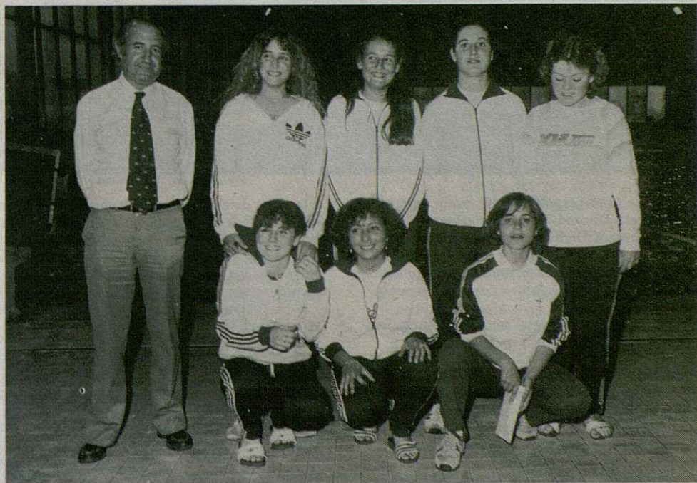
Natación sincronizada C. N. GRANOLLERS - Temp. 80-81