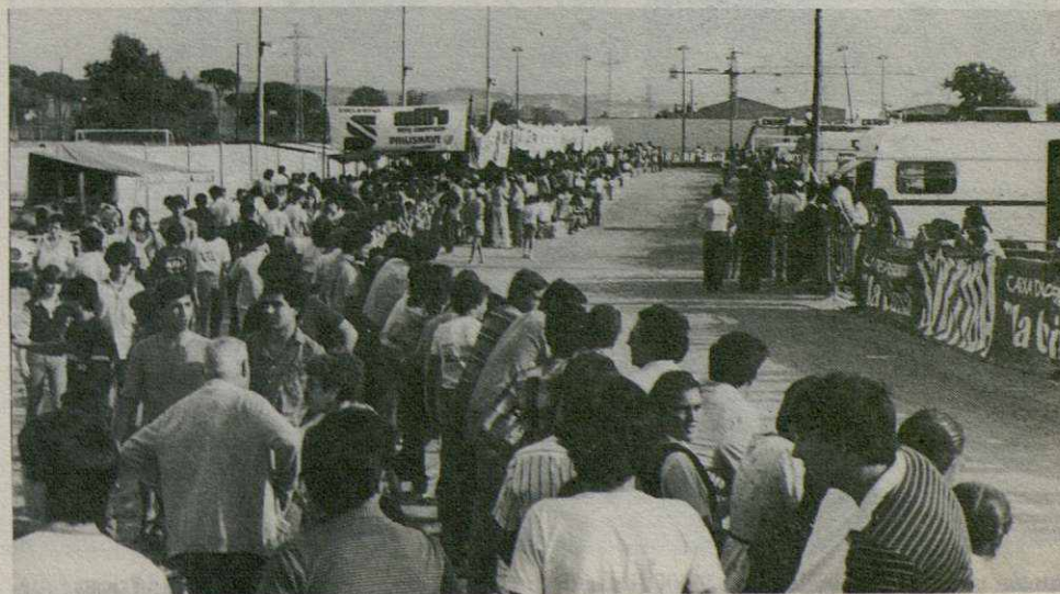
Aspecto que presentaba el circuito momentos antes de darse la salida.