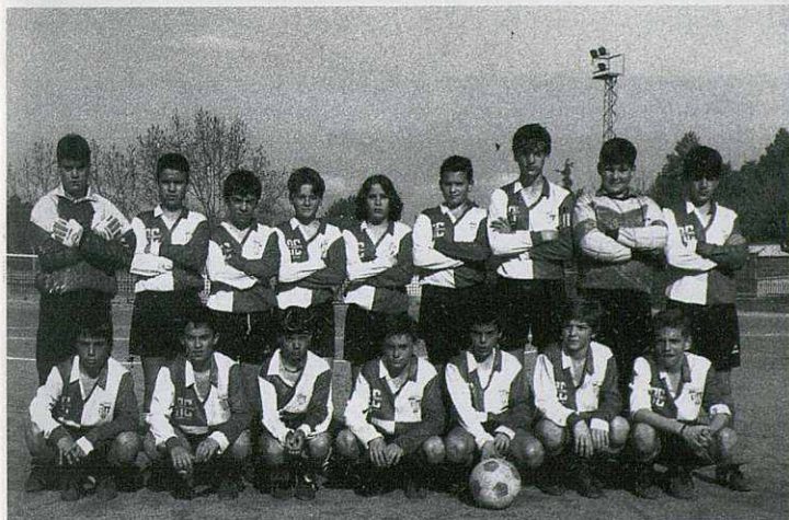
Infantil "B" C.F. Martorelles