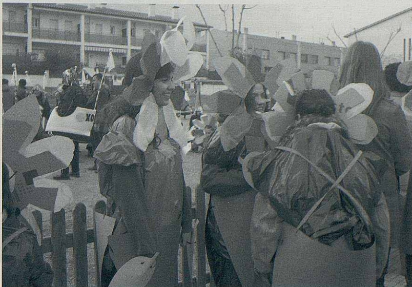
Carnestoltes infantil a la plaça 11 de setembre.

cavila entre el centre cívic La Fàbrica i l'Església amb la participació de cavalls, carros i algun tractor, tots ells precedits per una xaranga, la imatge de Sant Antoni Abat i els tres abandonats. Un cop a l'Església es van fer els tradicionals Tres Tombs i la benedicció d'animals, al mateix temps que l'Associació Ronçana Comerç Actiu repartia els típics panets de Sant Antoni. La Festa finalitzà amb un dinar popular i ball.