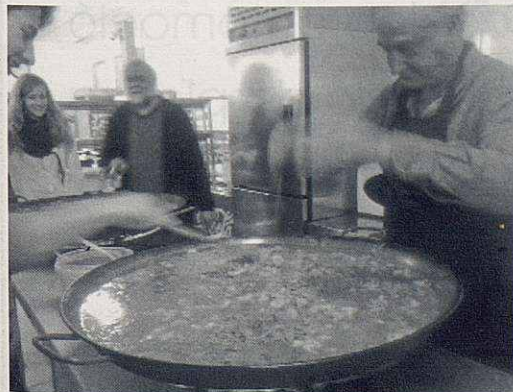
Preparant el dinar solidari.