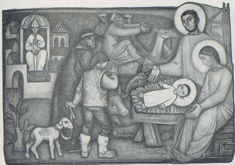
Obra de Lluçà.