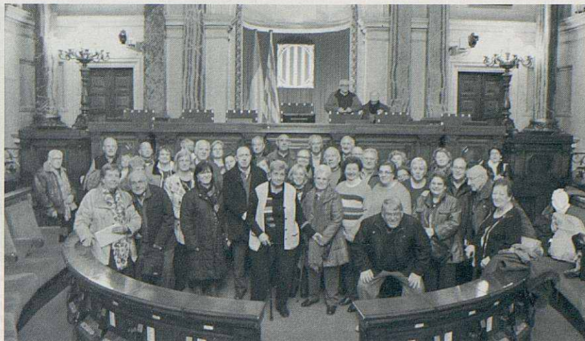
Visita al Parlament de Catalunya.

Al febrer teníem programada la sortida per fer una bona calçotada a La Masia de Taradell. Al matí, després d'un bon esmorzar, vam anar cap a Sant Quirze de Besora per visitar la destil·leria "Ratafia Bosch" on vam assaborir un pastisset que elaboren al Voltreganès acompanyat d'una degustació de ratafia. Tot seguit ens vam dirigir cap a Les Masies de Voltregà on vam visitar un petit museu concebut com un espai per ajudar a mantenir el record de la forma de vida que hi havia a Osona no fa gaires anys. Un cop acabada la visita vam fer un breu recorregut en autocar per la ciutat de Vic abans de dirigir-nos novament cap a La Masia de Taradell on, per fi, vam gaudir