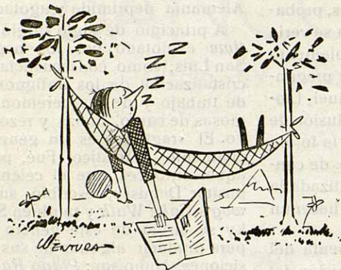
Este mes no hay chiste por estar el dibujante de vacaciones

Quise.— 7. Símbolo del sodio : Organismo internacional : Campeón.— 8. Abreviatura : Nota musical.— 9. Capital española.