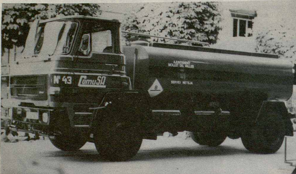
Camión cuba, con capacidad para 9.000 litros, destinados al riego, baldeo y una boca de riego a presión para limpieza.

Hasta la fecha—añade—estos Servicios de limpieza y recogida de basura se llevaban a cargo de forma separada, corriendo cada uno de ellos a cargo de una empresa distinta, con lo cual surgían problemas de coordinación, aparte que los contratos, debido a su antigüedad, estaban desfasados. El Departamento, a la vista de ello, optó por aunar dichos aspectos, adjudicándolos en subasta pública, por 8 años, a la Empresa COMUSA, que se creyó la más idónea y la mejor dotada en cuanto a medios y planificación.