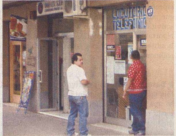
Els locutoris també s'han multiplicat en els darrers anys

d'obra és molt barata». Des del departament d'economia de l'Ajuntament, s'està treballant en la nova ordenança reguladora pels locutoris per tal que compleixin unes condicions mínimes higièniques, d'espai i de localització perquè no es concentrin tots a una mateixa zona. No obstant, "la llei de mercat i de lliure competència no ens permet establir un màxim de locutoris o basars que puguin haver a la nostra ciutat, però si els podem fer complir uns horaris". En aquest sentit, fa pocs mesos es va fer actuar la llei per fer