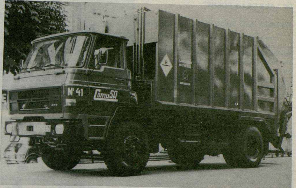
2 camiones Barreiros C-17 con caja de 19 m.3 de basura compactada. Uno, de los dos tiene acoplado un sistema de recogida de contenedores. Este sistema se está poniendo en práctica en Mollet experimentalmente, con magníficos resultados.