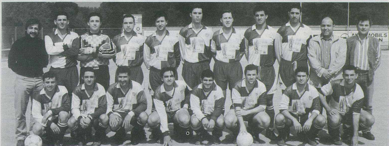
Plantilla primer equipo C.F. Lliçà de Vall, cuarto clasificado en el grupo IV de Segunda Regional