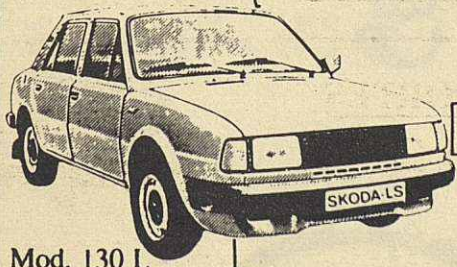
Mod. 130 L