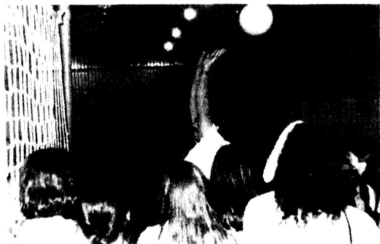
El monitor explica la tècnica del voleibol.