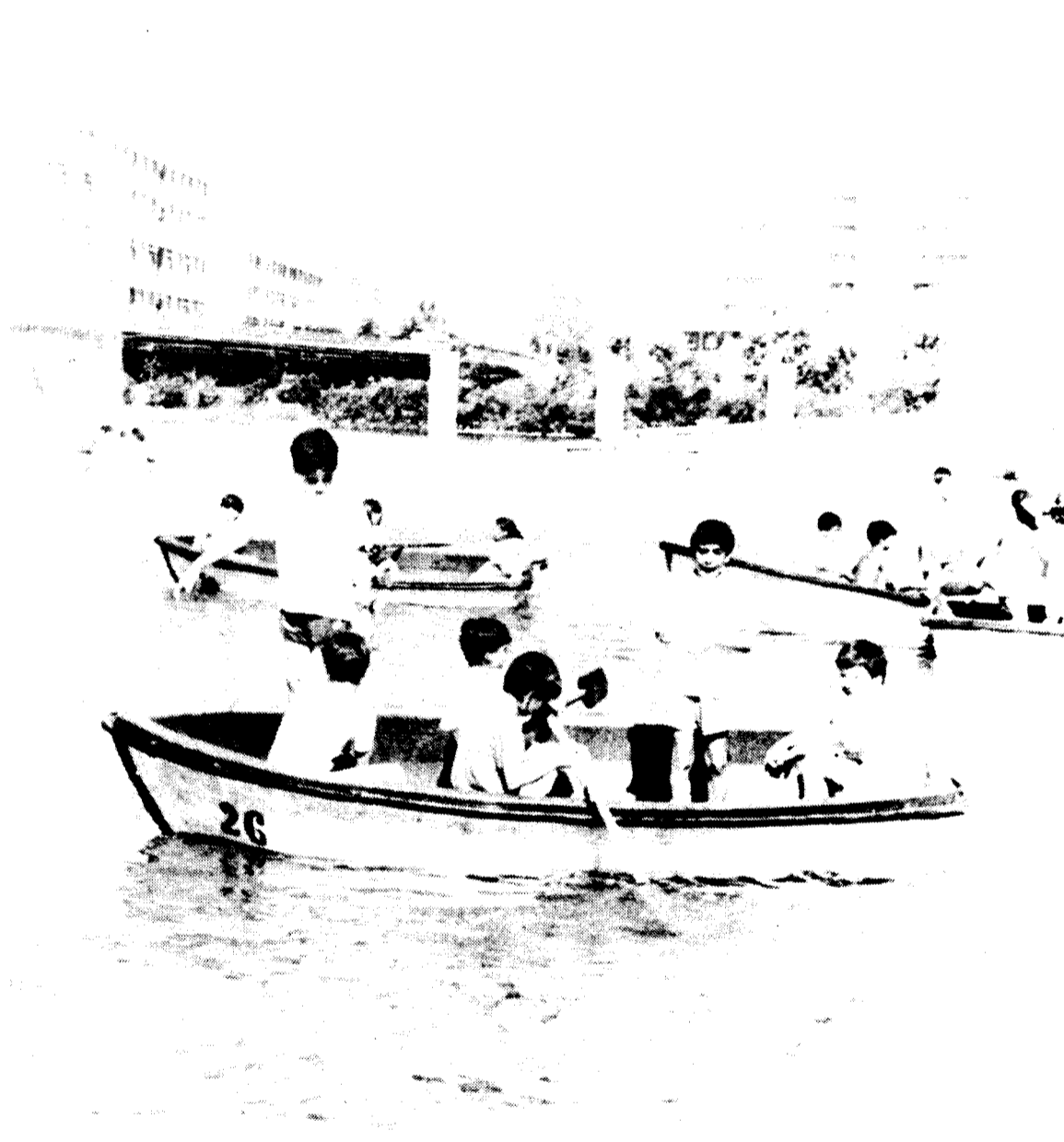
L'estany del Parc de Ponent entrena futurs remers olímpics.