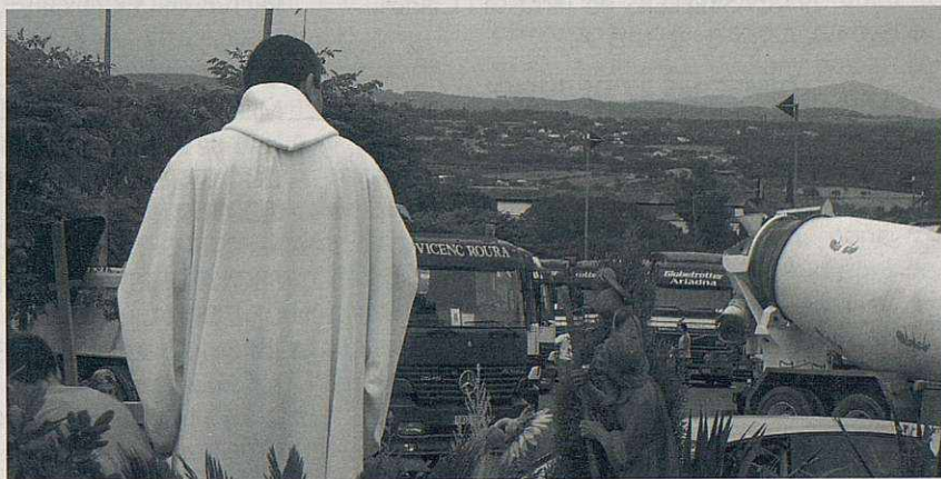
Moment de la benedicció dels vehicles, per Sant Cristòfol.

Aquest any el primer acte, la prova cultural, serà dimecres, encara que el veritable tret de sortida el dona, tal