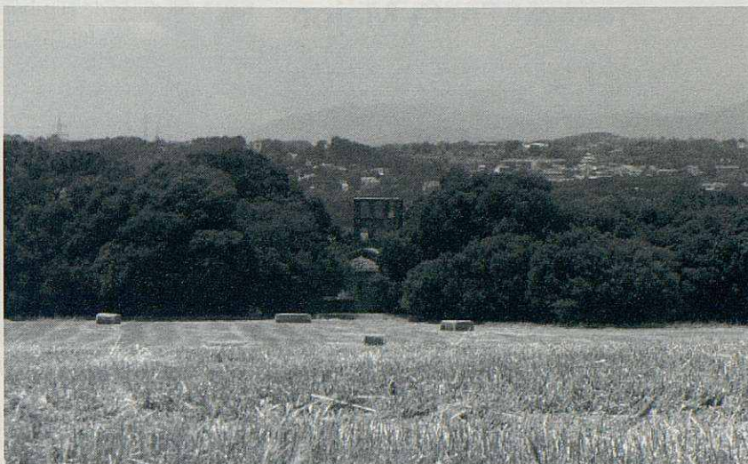
L'ermita de Santa Justa i el seu entorn.

Durant el mes de juliol la Biblioteca Ca l'Oliveres ofereix diverses activitats gratuïtes adreçades al públic infantil. Els dilluns 1, 8 i 15 de juliol, de 4 a 8 de la tarda, la sala infantil es converteix en un espai de jocs educatius, cooperatius, d'estratègia i de foment de la lectura per a passar-ho