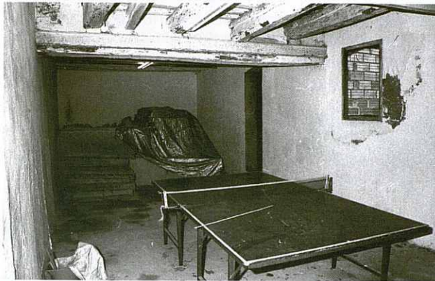
Aspecte actual de la planta baixa on s'ubicarà la futura sala d'exposicions de l'AEG.