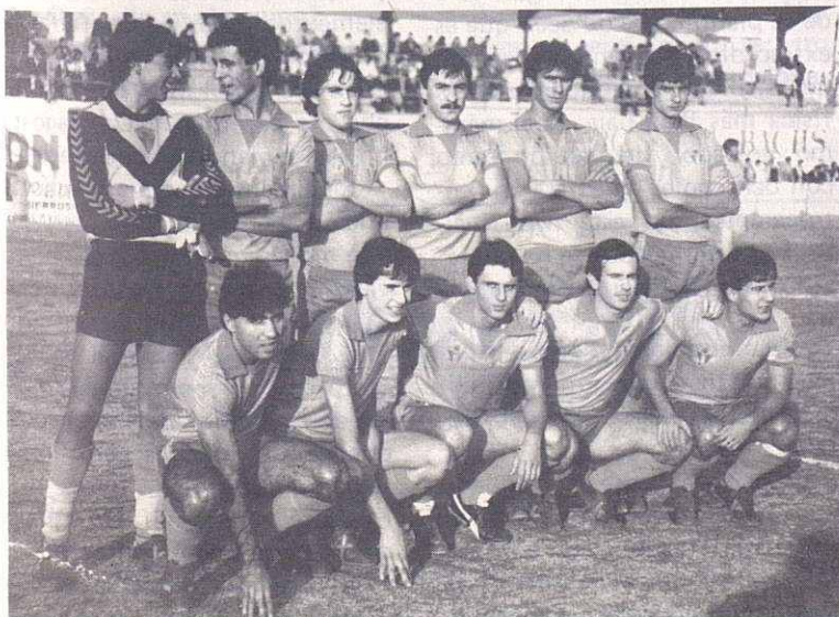
Primer equipo del Canovelles