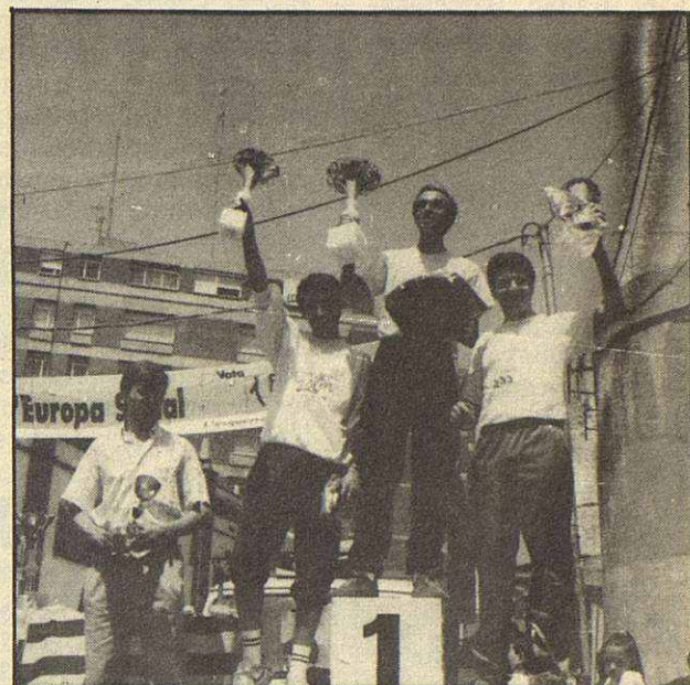
CLASIFICACION FINAL POR CATEGORIAS