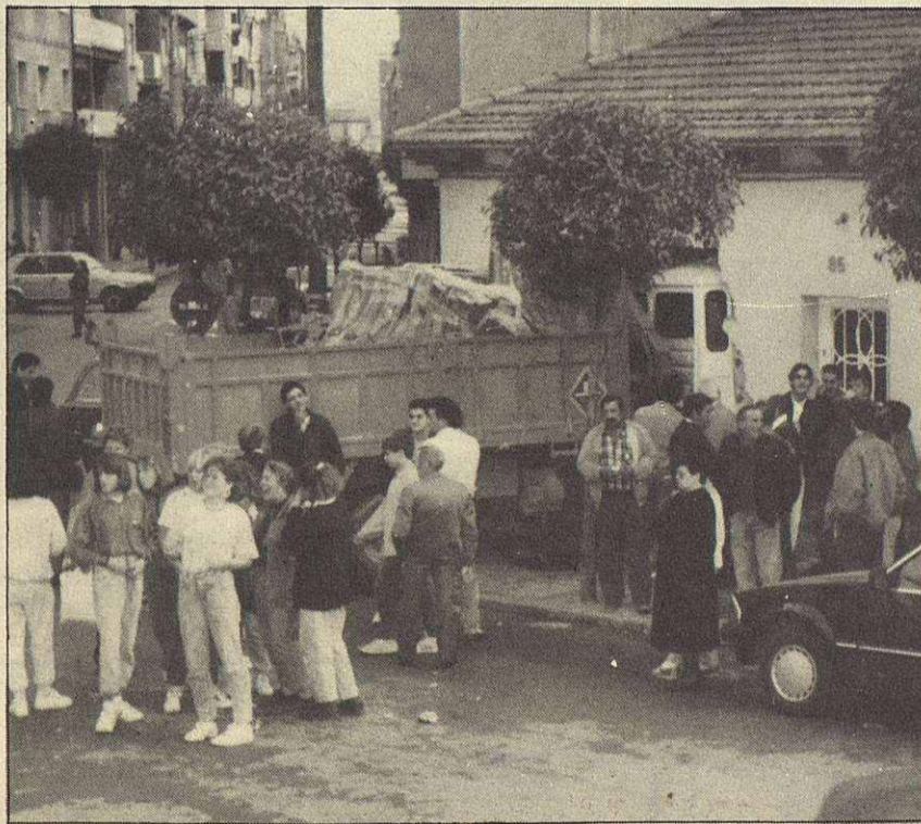
Sin duda es la imagen del mes. Un camión se empotró en la casa situada en la calle Cayetano Vinzia, junto al puente del ferrocarril. Por suerte sólo fue un susto. Los daños fueron pronto reparados. Felicitamos al fotógrafo, F. Sánchez, por su espontaneidad.

La contaminación por residuos urbanos e industriales es el principal factor de degradación del Parque Natural del Montseny, según un informe realizado por la Liga para la Defensa del Patrimonio Natural (DEPAN).