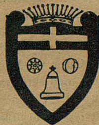
Fig. núm. 3

La Lluna en quart minvant s'atribueix a la Casa Osona que eren Senyors de la vila (1500).