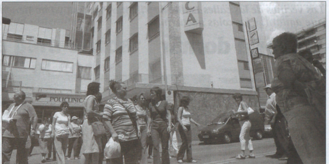
Una manifestación de los ex-trabajadores de Policlínica en la víspera de abandonar la empresa.