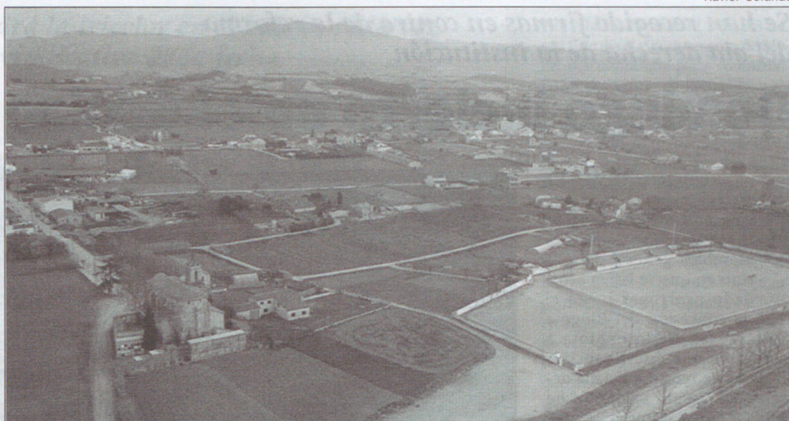
El Ayuntamiento nunca ha dudado en mantener la calificación agrícola de Palou, consciente de los intereses que se ventilan.

Acogería la mayor parte de las nuevas superficies comerciales aprobadas por la Generalitat para el Vallés Oriental