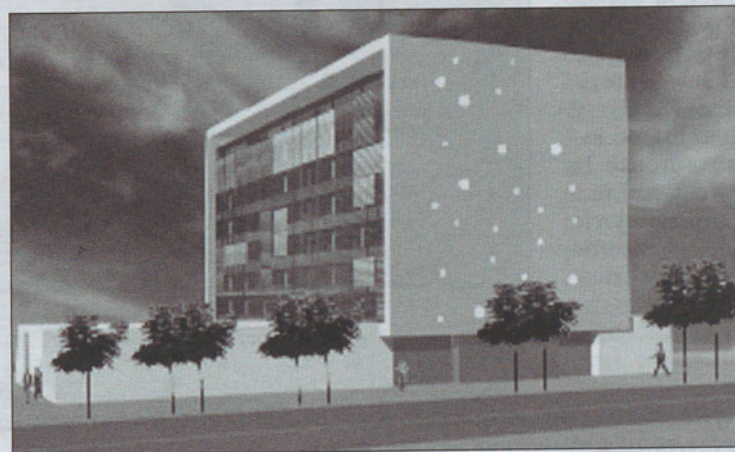
Dos perspectivas diferentes del Palau de Justicia que se empezará a construir a finales de año.