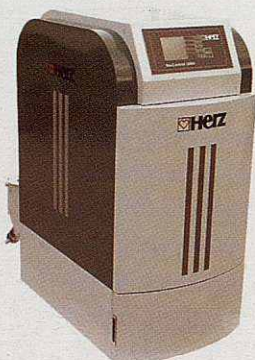
Caldera de biomassa automàtica