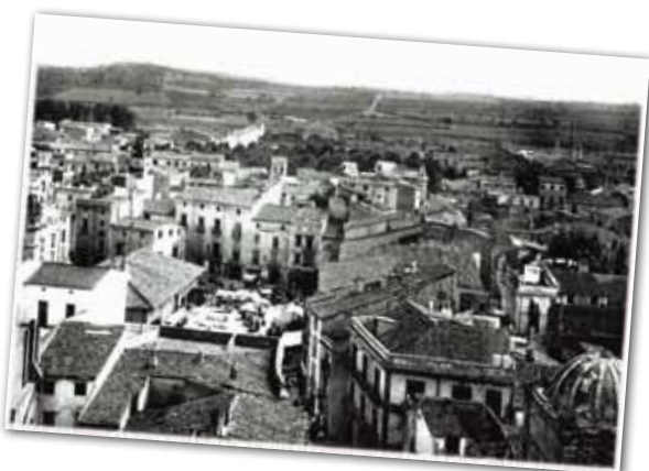
VISTA PARCIAL DE DE GRANOLLERS DELS ANYS 20.

El 7 de març de 1922 el Rei Alfons XIII va concedir el títol de ciutat a la vila de Granollers. Les raons d'aquesta distinció s'expliquen en el creixent desenvolupament de l'agricultura, la indústria i el comerç i la seva constant adhesió a la monarquia, segons consta en el real decret corresponent.