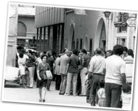
IMATGE DEL CINEMA ASTORIA, SITUAT AL PRIMER PIS DEL CARRER D'AGUSTÍ VINYAMATA, A TOCAR DE CALA SILA, ANY 1980.

Durant uns anys va ser el millor cinema local. S'hi projectaven pel·lícules en 35 mm de forma regular, s'hi lliurava un documentat programa de mà i, a més, s'hi feien col·loquis molt sovint. D'aquesta forma arribaren a Granollers films destacats com Cleo de 5 a 7 , Teléfono rojo, volamos hacia Moscú , El eclipse o Un verano con Mónica... També es van projectar al cinema Astoria, l'any 1961, les pel·lícules rodades pel pioner del cinema granollerí Ramon Dagà als anys 20.