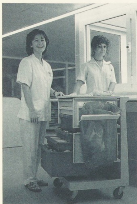
Els nous carros de cures "Herman Muller".

Darrerament, la Infermeria d'aquest centre ha realitzat una sèrie de canvis notoris en el sistema de treball. Actualment funciona per equips. Això significa que a cada un d'ells li és assignat un nombre determinat de pacients, i d'aquesta manera ofereix una assistència molt més integral i personalitzada; tot això deriva en una millora de la qualitat assistencial, que és l'objectiu primordial de l'Hospital.