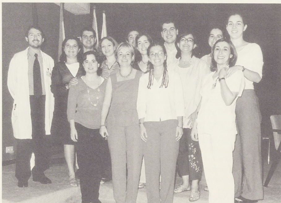
Llevadores i metges especialistes a l'acte de comiat.