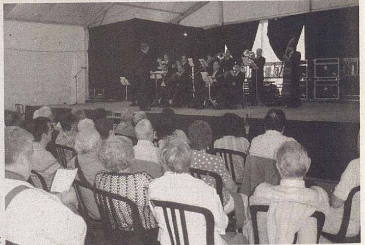
Serenata Vuitcentista a l'envelat

La participación de las entidades en la organización de la programación festiva es fundamental. En esta edición coincidía el 25 aniversario de la colla Gegantera, por lo que esta entidad tuvo una presencia especial dentro de la fiesta, aunque la lluvia hizo deslucir alguno de sus actos como la XIV Trobada de Gegants, en la que se