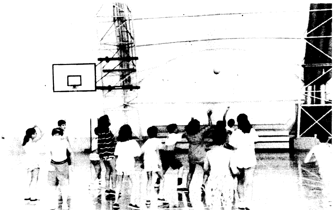
Pavelló Congost, jugar és passar-ho bé.

Però aquest programa es pot veure modificat per tres altres activitats: excursió en autocar, excursió a peu o activitats a Ponent-Congost. L'excursió en autocar a Castelldefels ja s'ha fet altres anys, i es tracta de passar tot el dia en aquesta població fent diferents activitats: pel matí anar a un petit parc d'atraccions, dinar al migdia, i a la tarda banyar-se a la platja i llançar-se per uns tobogans aquàtics. Com que només es fa dos dies, no poden anar-hi tots els nens i s'ha de fer per sorteig, que aquest any va fer que hi anessin els grups A-6 i A-10 el dia 11, i els I-13 i J-16 el dia 18. Les excursions a peu, que es fan aquest any per primer cop, són fetes cada dia per dos grups, i cada grup en fa dues. Les excursions són, bàsicament, d'uns 14 Km. pels voltants de la nostra ciutat, com ara a Marata, la Roca o Palou, amb tornada a