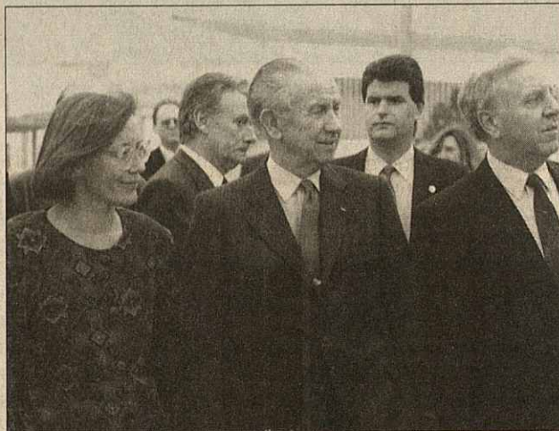
Samaranch durante la supervisión de las instalaciones

Aunque las pruebas olímpicas en la sede de Mollet tuvieron lugar desde el 26 de julio hasta el 2 de agosto de 1992, hacía varios años que se estaba preparando toda la infraestructura que requería la competición. De esta forma en el barrio de Lourdes, detrás de la Escuela de Policía de los Mossos d'Esquadra, se inició la construcción de lo que sería la mejor instalación de tiro de Europa, algo que iba atrayendo la visita de diversas personalidades políticas y deportivas para supervisar la evolución de las obras, durante estos años vinieron en diferentes ocasiones, Juan Antonio Samaranch y Pascual Maragall , entre otros.