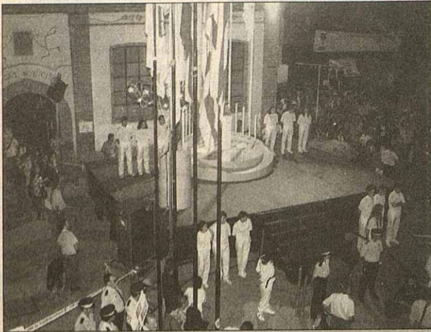
La Plaza del Ayuntamiento se llenó para recibir la antorcha