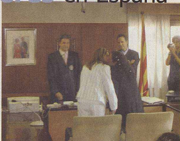
Boda histórica en Mollet

la decisión que habían adoptado, que aumentaron ante la inesperada presencia de tantos periodistas con cámaras fotográficas, de televisión y micrófonos que durante estos días las han inmortalizado, pasando a la historia por haber sido la primera pareja de mujeres en lograr casarse en España. La ceremonia tuvo lugar con una hora de retraso pero transcurrió con normalidad. Aplausos por parte de los invitados a la entrada a la sala del juzgado donde les esperaba el juez Jorge Vergara, titular del Registro Civil y decano en Mollet, quién utilizó la fórmula de "cónyuges" para dirigirse a ellas en el momento del "sí quiero".