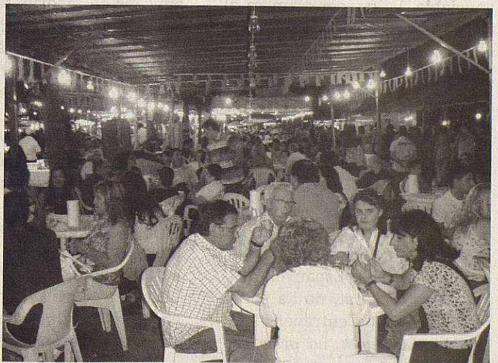
Chiringuitos del recinto ferial