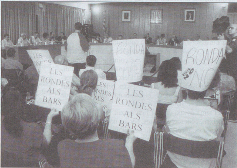
Los regidores de ERC retiraron a última hora una moción contra la Ley Orgánica de los Partidos Políticos que tiene como objetivo ilegalizar a las formaciones políticas que apoyen la violencia.