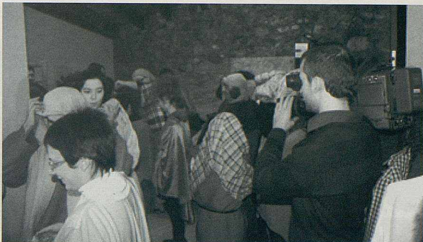
El càmera de la Cuatro pren plans en el vestidor dels Pastorets.

El dia de Reis hi ha la segona representació.