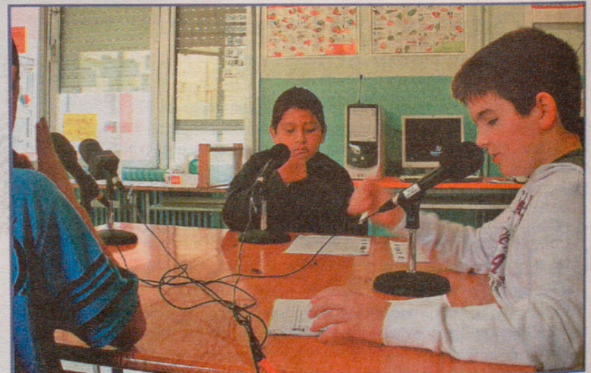
RÀDIO: Millorar la competència lingüística del nostre alumnat és un dels nostres objectius.

No menys important, és l'esforç econòmic per adaptar les infraestructures informàtiques al nou model. Actualment totes les aules estan dotades d'una pantalla de projecció, d'accés a la xarxa interna i a Internet, tant física com sense fils. Disposem d'ordinadors suficients a les aules d'informàtica, anglès i biblioteca per