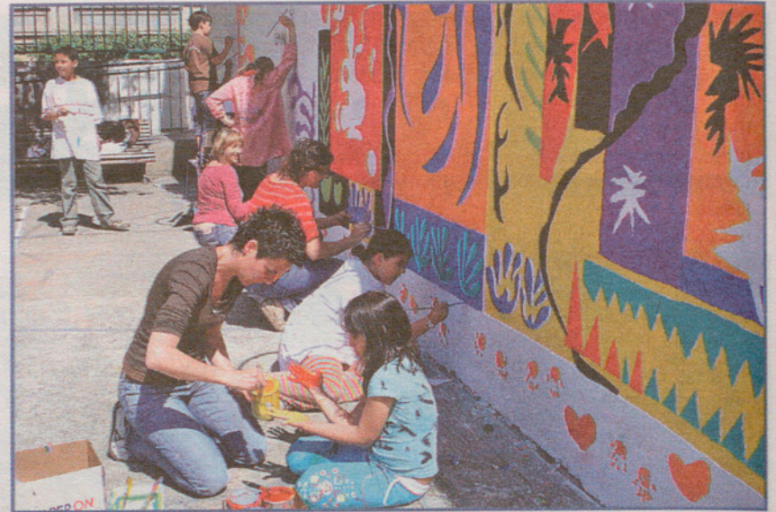
TALLERS: Mestres, alumnes, pares i mares participen en la decoració de l'escola.

el seu vocabulari, i l'últim, però no menys important, afavorir la relació entre les famílies i l'escola.