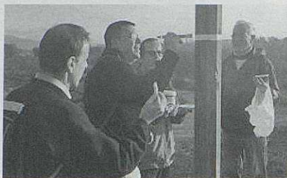
A la foto, membres de l'entitat en plena feina.

La nostra entitat es fa responsable del manteniment de la senyalització del PR C-10 que envolta Santa Eulàlia.