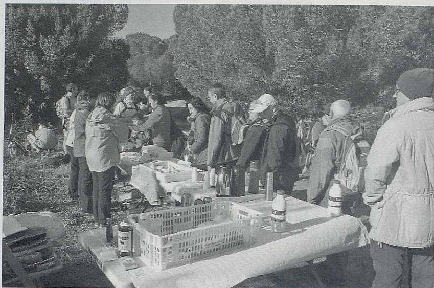
El repartiment dels entrepans de pa amb tomaquet i butifarra a la brasa, encara calenta!