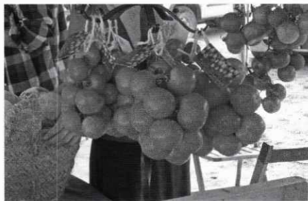
4a Edició de la Fira del Tomàquet.