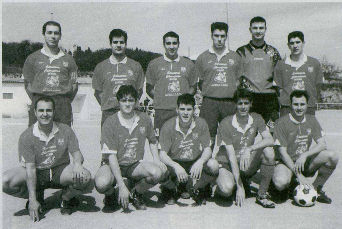
Primer equipo C.F. La Torreta

En este sentido, el presidente del club ha lanzado unas duras acusaciones que afectan de manera indirecta