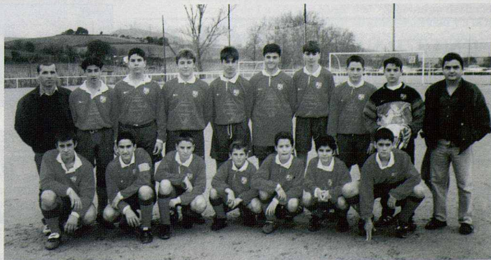
Plantilla del Infantil "A"