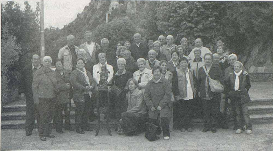
El grup al Santuari Queralt.

Per l'excursió del mes de juliol tenim programada la sortida per anar a visitar les Drassanes Reials de Barcelona i més concretament el seu Museu Marítim, un espai dedicat a la construcció naval entre els segles XIII i el XVIII. Ens mostraran l'espai restaurat del museu, on es troba la rèplica de la Galera Reial, que permet explicar la història de l'edifici i la seva relació amb el món del mar i la ciutat.