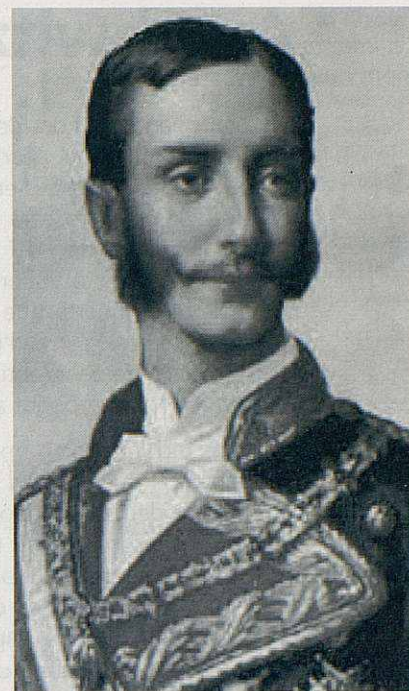
El conde de España.

El cert és que en el País Gran donen símptomes d'una certa por i estan incrementant tant com poden, les moltes i moltes repressions disfressades de recursos als tribunals, d'intentar tombar las lleis proclamades en el nostre Parlament, etc. Però jo crec que ells mateixos s'estan ficant en un atzucac del que difícilment en podran sortir i, per tant, podem seguir mantenint la confiança que en un temps més o menys proper, o llunyà, aconseguirem, per fi, ésser independents.